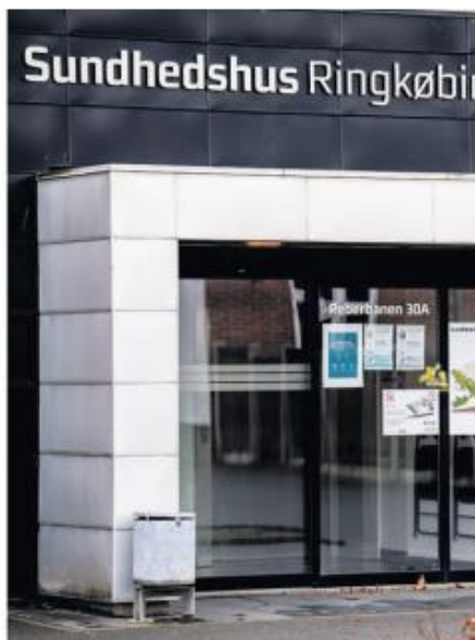
Et nyt nærhospital kan placeres i enten Tarm eller Ringkøbing.

Og begge steder er der velegnede lokaler, som kan sammenstykes til de funktioner, et nærhospital skal kunne varetage. Men mursten er kun en del af argumentationen for placering. Som allerede analyseret i kommunerne nord for os, skal der tages hensyn til geografi, infrastruktur, sygdomstygnde, socioøkonomiske faktorer (har man bl.a. overskud, netværk og råd til transport), ligesom hensynet til nabokommunens tilbud skal indregnes.